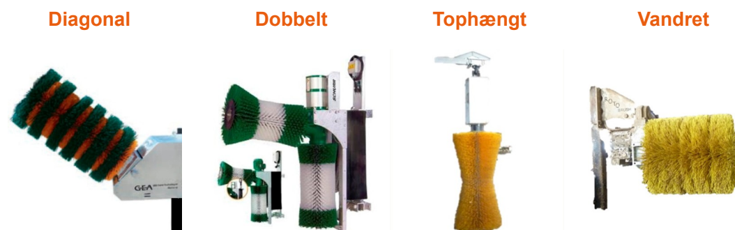
Figur 1 De fire typer kobørster: Diagonal, dobbelt, tophængt og vandret.

Kobørster kan inddeles i fire typer, som beskriver børstens retning (figur 1). Klik på overskriften og se børsten i aktion.